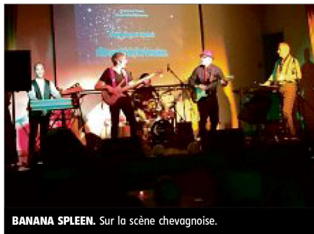
BANANA SPLEEN. Sur la scène chevagnoise.

Les Banana Spleen, invités de Chevagnes En Sologne Bourbonnaise, ont présenté, samedi soir, leur nouveau spectacle « La quarantaine rugissante » à la salle polyvalente, devant un peu plus de quatre-vingts personnes.